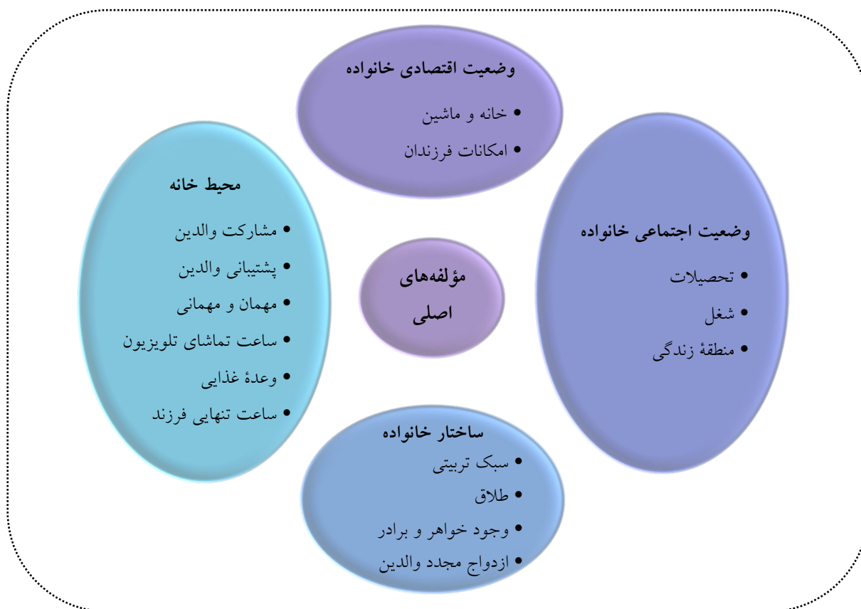
شکل ۲. محورهای اصلی و فرعی خانه و خانواده

پژوهش حاضر با هدف شناسایی پیامدهای خانه و خانواده دانش‌آموزان ابتدایی مناطق ۴ و ۱۵ تهران و بررسی پیشرفت تحصیلی آنان انجام شد که بررسی‌ها نشان‌دهنده اهمیت کارکرد محیط خانه و خانواده و پیامدهای آن است که بر پیشرفت تحصیلی دانش‌آموزان دارند. یافته‌های پژوهش پیامدهای خانه و خانواده را در پنج