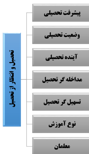
شکل ۲. مدل توصیف پیشرفت تحصیلی (تحصیل و انتظار از تحصیل) از دید والدین و دانش‌آموزان خانواده‌های فقیر

در شکل زیر تصویر کلی از نتایج تحلیل کیفی داده‌های مربوط به توصیف پیشرفت تحصیلی (تحصیل و انتظار از تحصیل) نشان داده شده است.