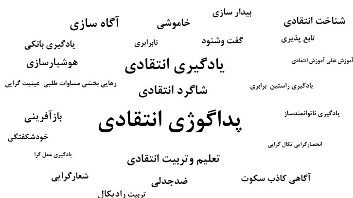
شکل ۱. ابر کلمات کلیدی گفتمان یادگیری فریره در پداگوژی انتقادی

فرکلاف روابط معنایی اصلی را شامل هم معنایی، شمول معنایی و ضد معنایی می‌داند. به عقیده وی یک جنبه از شناسایی ارزش تجربی کلمات وابسته به شناسایی روابط معنایی در متون و مشخص کردن شالوده‌های ایدئولوژیک آن‌ها است [۷۳]. برای ترسیم نمودار زیر ابتدا روابط هم معنایی و شمول معنایی در متون تالیفی فریره شناسایی شده و بعد با ارزیابی کلمات مختلف، مفهوم اصلی آن‌ها استخراج شده است. سپس مفاهیم کلیدی بر اساس بسامد تاکید بر آن‌ها در متن به صورت ابر کلمات ترسیم شده‌اند.